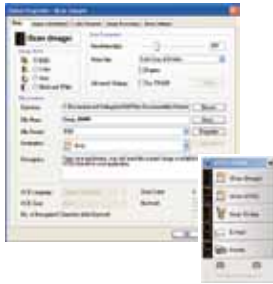
Das Hauptfenster des Button Manager 2

Mit dem Avison Button Manager 2 können komplexe Scanvorgänge mit nur einem Tastendruck erledigt und direkt an die gewünschte Zielanwendung gesendet werden.