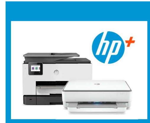
HP OfficeJet Pro 90xxe

Entscheidung für HP+ während der Druckerinstallation