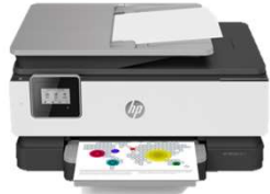
OFFICEJET 8012e/15e OFFICEJET PRO 8022e