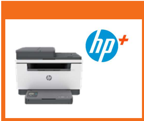
HP LaserJet xxxe