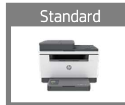
HP LaserJet xxx