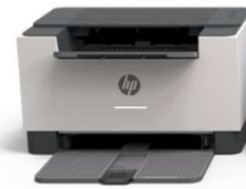
LASERJET M209e Serie