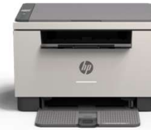
LASERJET M234e MFP Serie