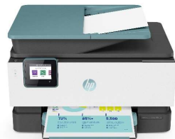
OFFICEJET PRO 9010e/9015e OFFICEJET PRO 9022e/9025e